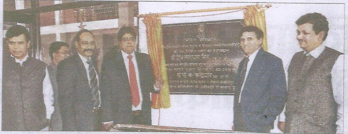
टैक्सदाताओं के साथ दोस्ताना रवैया रहेगा, कोल्हान सबसे ज्यादा राजस्व देने वाला कमिश्नरी बनेगा